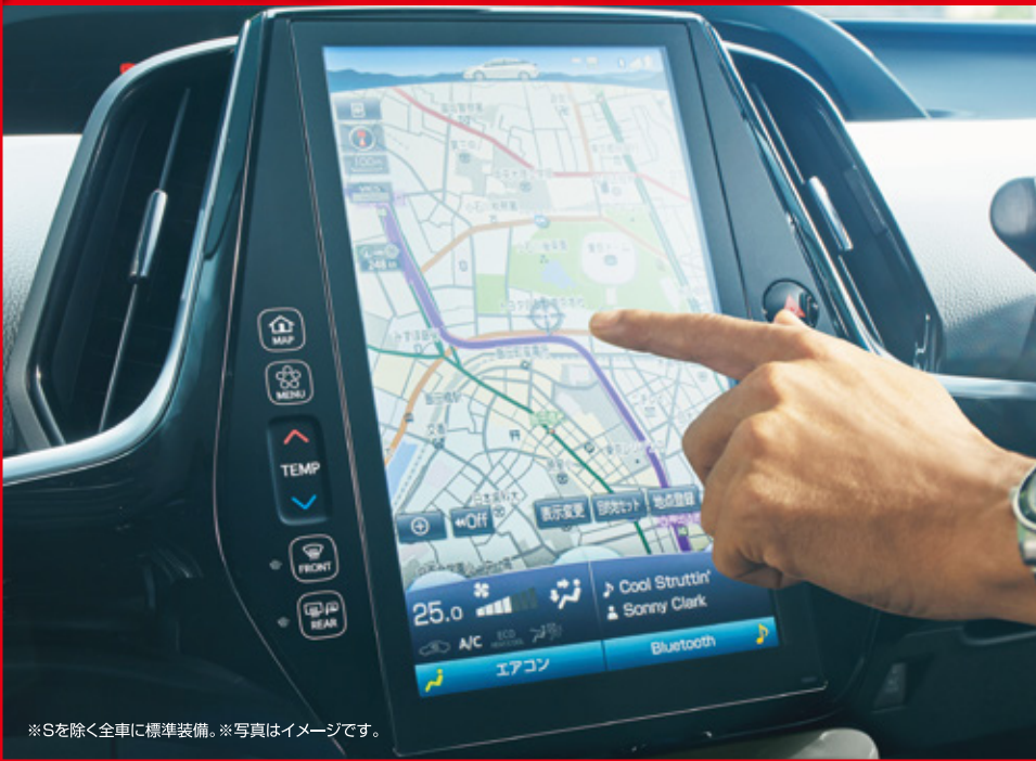
※Sを除く全車に標準装備。※写真はイメージです。